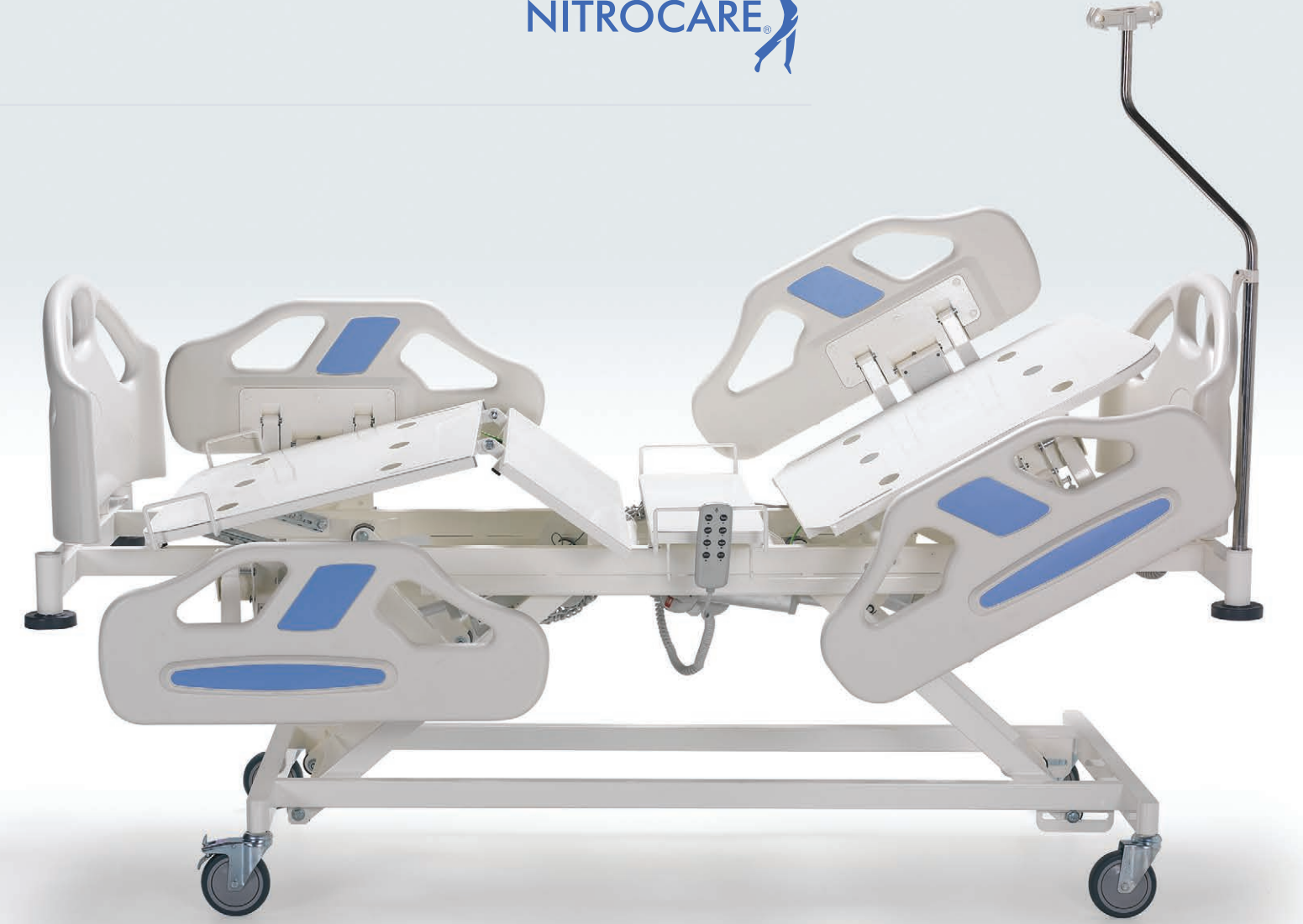
Ürün Görselleri Seçilen Aksesuar ve Opsiyonlara göre Farklılıklar Gösterebilir. Product Images May Vary According to Selected Accessories and Options.