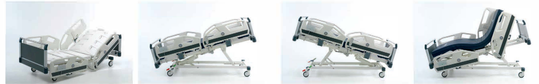
SIRT HAREKETİ BACKREST AYAK HAREKETİ LEGREST SIRT - AYAK BACKREST-LEGREST DİZ KIRMA KNEE BREAKING YÜKSEKLİK HEIGHT TERS TRENDELEBURG REVERSE TRENDELEBURG TRENDELEBURG TRENDELEBURG KARDİYAK CARDIAC