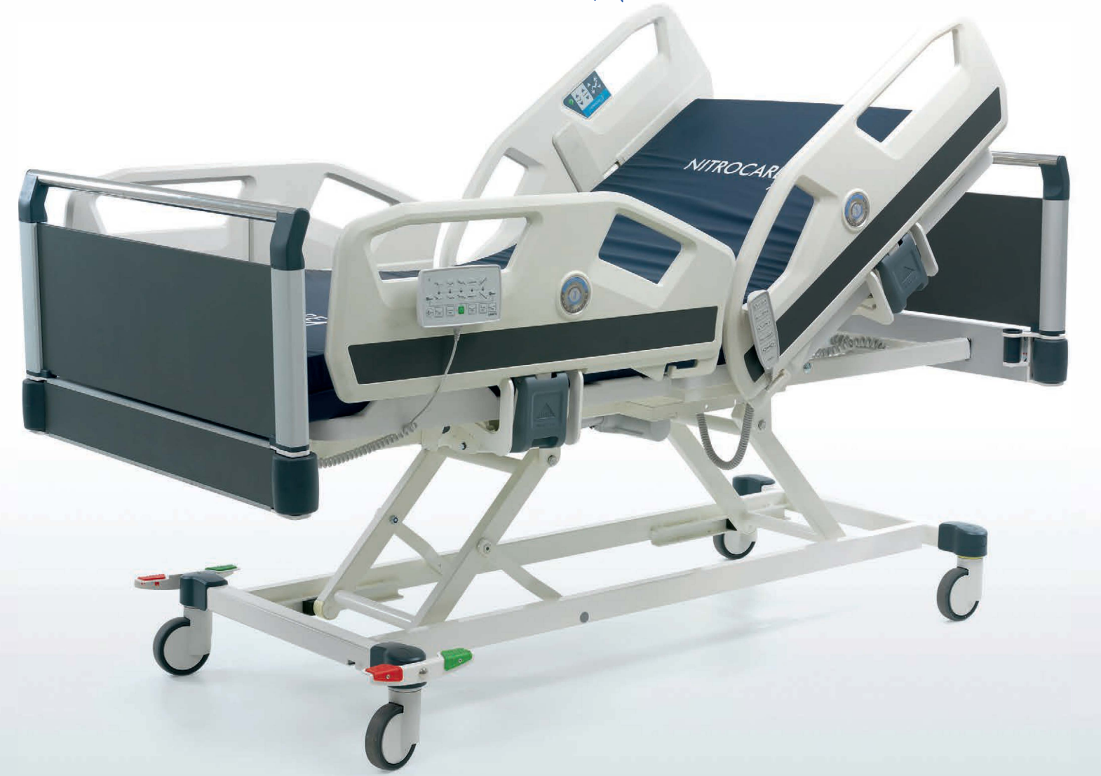
Ürün Görselleri Seçilen Aksesuar ve Opsiyonlara göre Farklılıklar Gösterebilir. Product Images May Vary According to Selected Accessories and Options.