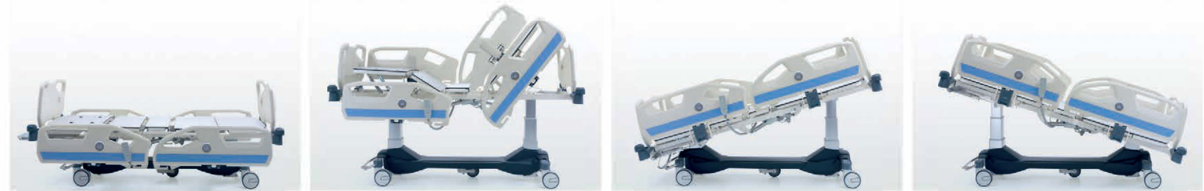
SIRT HAREKETİ BACKREST AYAK HAREKETİ LEGREST SIRT - AYAK BACKREST-LEGREST DİZ KIRMA KNEE BREAKING YÜKSEKLİK HEIGHT TERS TRENDLENBURG REVERSE TRENDLENBURG TRENDLENBURG TRENDELBURG KARDİYAK CARDIAC