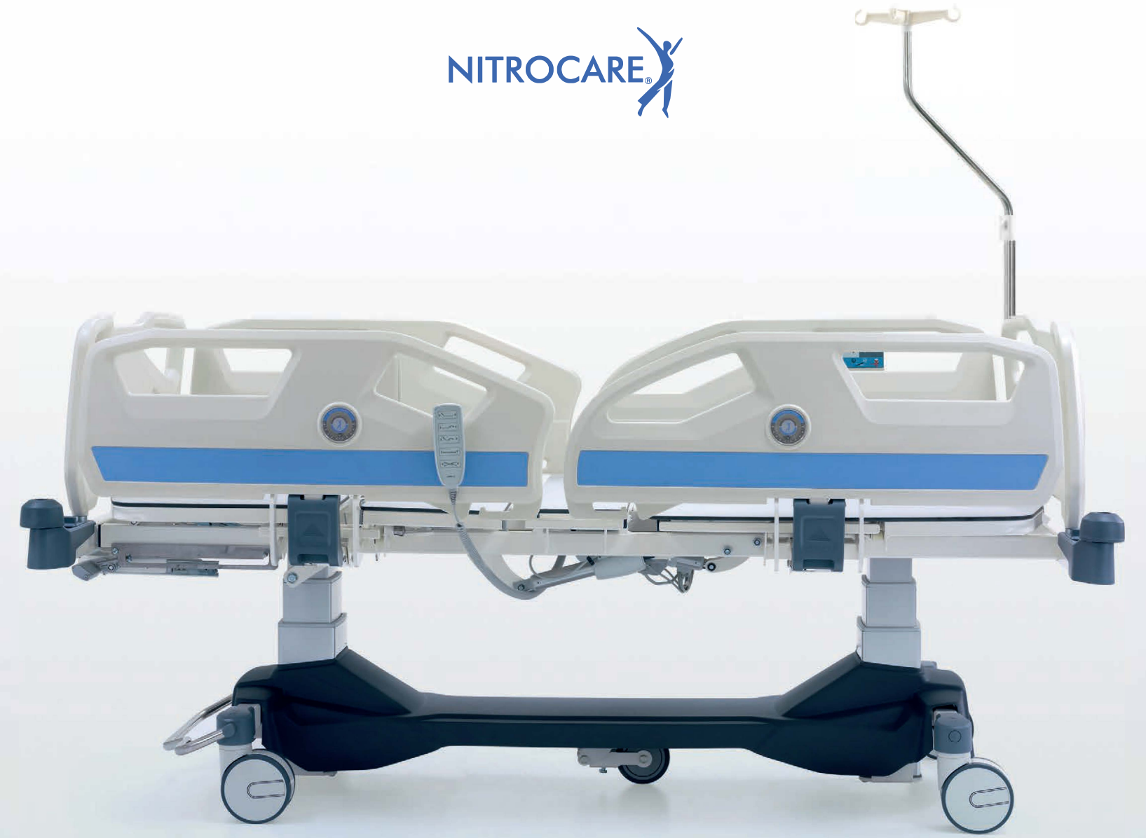
Ürün Görselleri Seçilen Aksesuar ve Opsiyonlara göre Farklılıklar Gösterebilir. Product Images May Vary According to Selected Accessories and Options.