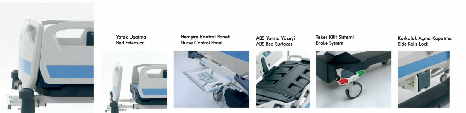
Yatak Uzatma Bed Extension