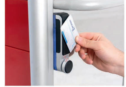
Elektronik kilit / Opsiyonlu Electronic lock / Options