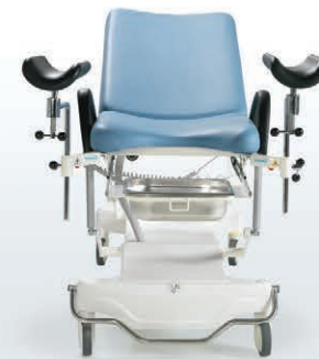
Paslanmaz Atık Toplama Küveti Stainless Steel, Removable Basin