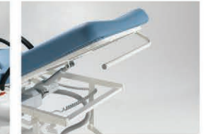
Kağıt Havlu Aparatı Paper Towel Kit